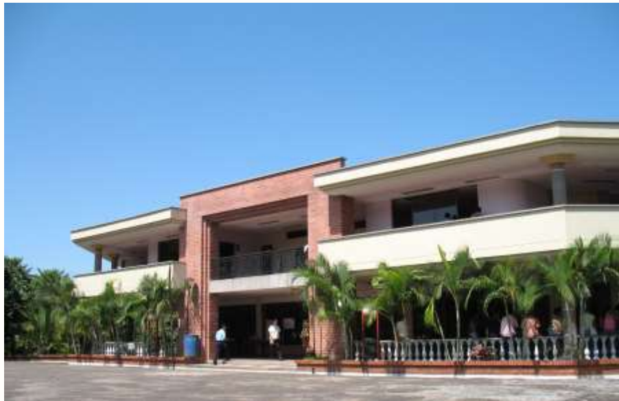
Auditorio Angel Cuniberti. Sede Principal Universidad de la Amazonía

La Sede del evento será la Universidad de la Amazonia, ubicada en la zona urbana de Florencia. Los actos principales se desarrollarán en el Auditorio Angel Cuniberti con capacidad para 500 personas y todas las comodidades requeridas para el bienestar de los participantes.