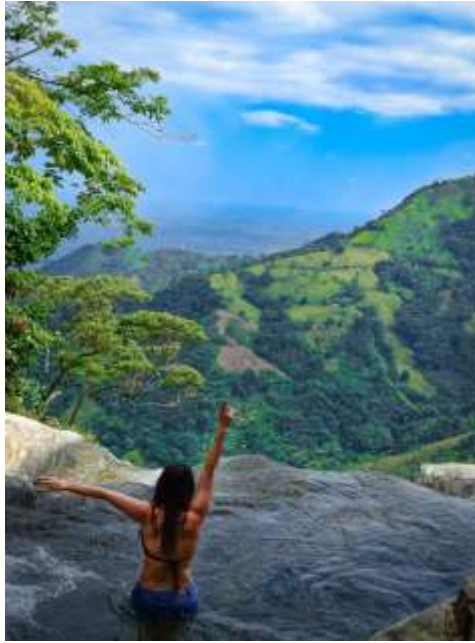
Panorámica de un paisaje del Caquetá

IV CONGRESO COLOMBIANO DE RESTAURACIÓN ECOLÓGICA I Simposio Internacional Amazónico de Restauración Ecológica Florencia, 30 de julio al 3 de agosto de 2018